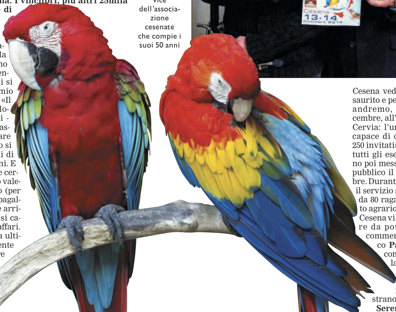
A destra presidente e vice dell'associazione cesenate che compie i suoi 50 anni

dici, provenienti da tutt'Italia, a decretare i vincitori. Per la bellezza gareggeranno 15.500 esemplari, mentre altri 500 canarini si disputeranno il premio nella gara di canto. «Il mondo dell'ornitologia - ha detto Rossi - vanta numerosi appassionati. Basta pensare che in tutto il mondo si vendono due milioni di anellini per i canarini. E se teniamo conto che certi esemplari possono valere anche 5mila euro (per non parlare dei pappagalli che possono anche arrivare a 10mila euro) si capisce bene il giro d'affari. Solo noi nella nostra ultima fiera "Naturalmente in fiera" a novembre abbiamo fatto 5.000 persone presenti. Per questo Campionato gli Ho- t e l d i